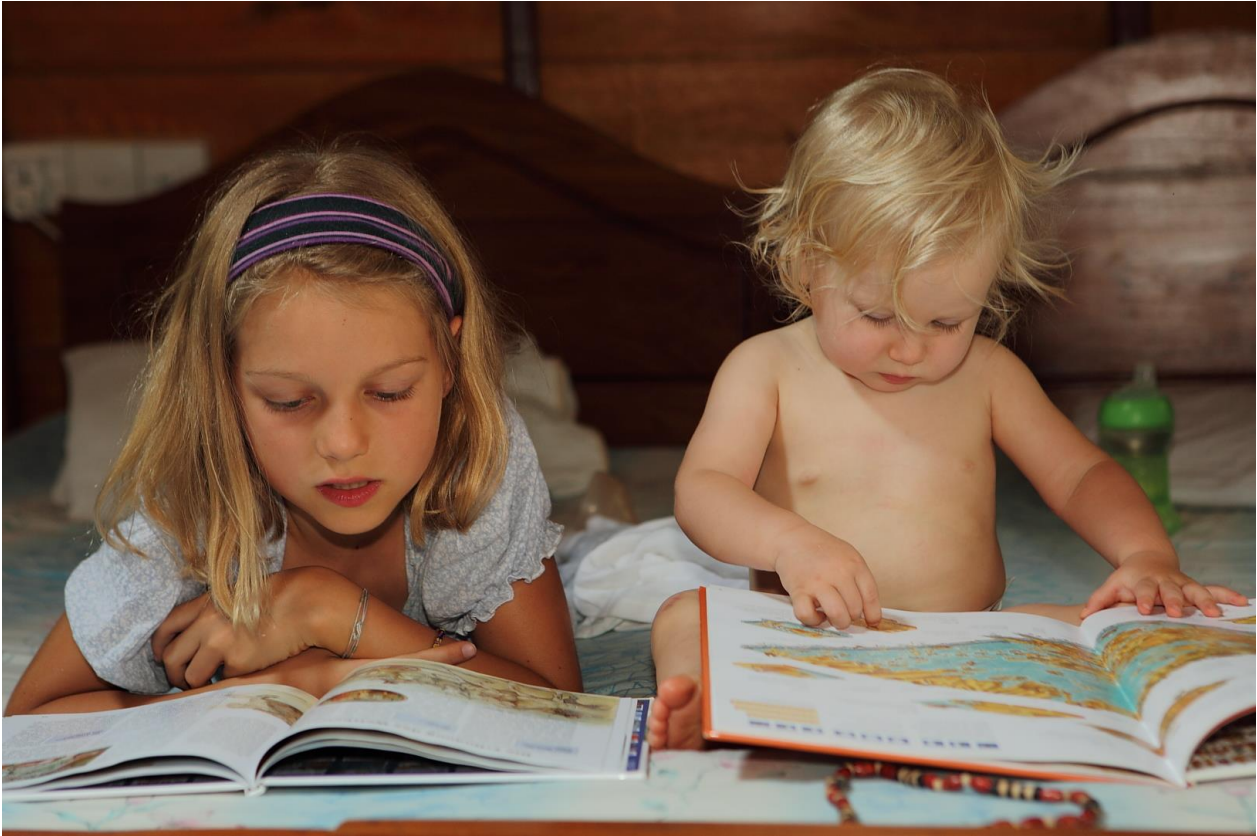
Unawatuna;, Sri Lanka: Zu zweit Lernen macht sowieso viel mehr Spaß.