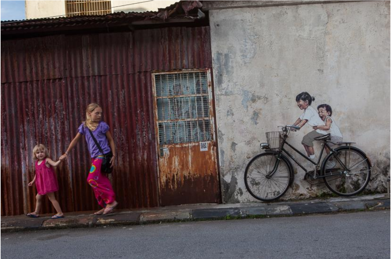
Amelie und Smilla auf der Flucht. Aber es ist alles nur gespielt. Denn das Rad ist zwar echt, aber die beiden Gören rechts sind nur auf die Wand gemalt (Georgetown, Malaysia)