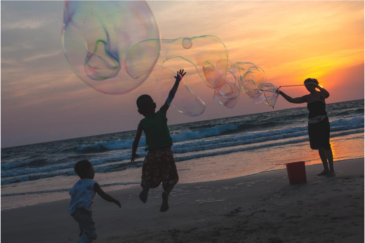
Burmesische Knirpse spielen mit Annette Seifenblasen-Fangen am Ngwe Saung Beach (Burma).