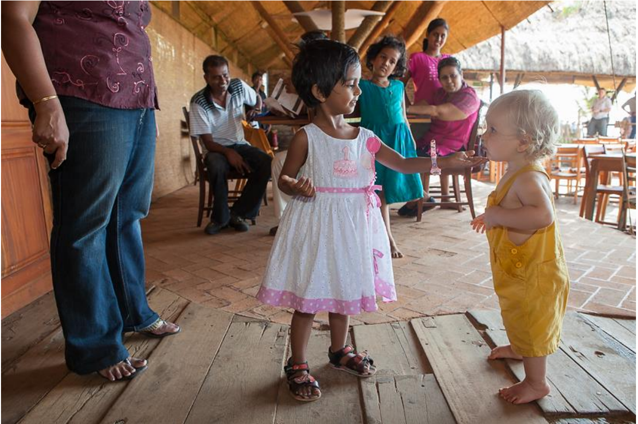
Smilla ist definitiv der schnellste Kontaktabhänger und Herzensöffner unserer Familie.