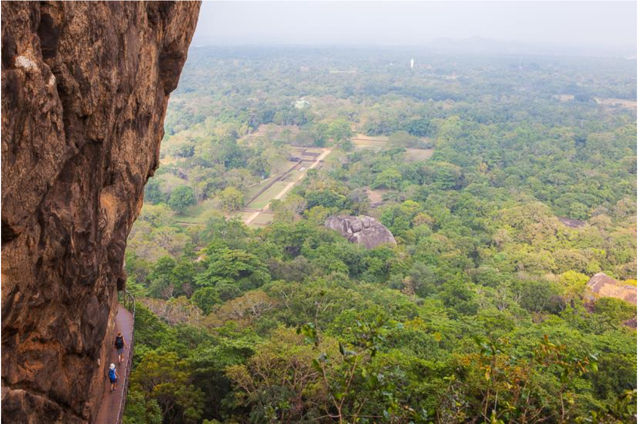
Abstieg vom Sigiriya-Felsen (Sri Lanka).