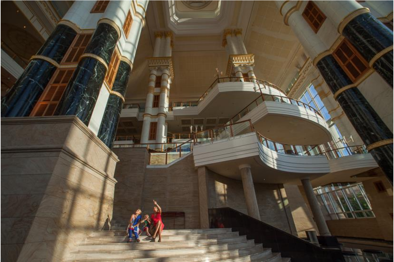
Brunei: Gigantomanie pur. Das Empire Hotel erinnert mit seinen Ausmaßen an den Petersdom in Rom.